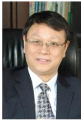
中方院长 郭烈锦 教授 中国科学院院士