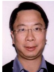
外方院长 余艾冰 教授 澳大利亚科学院院士 澳大利亚工程院院士 中国工程院外籍院士