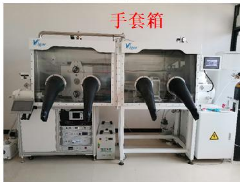
无序物质科学研究中心实验条件