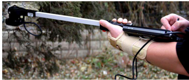
植被冠层数字图像分析系统